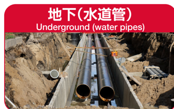
地下(水道管) Underground (water pipes)