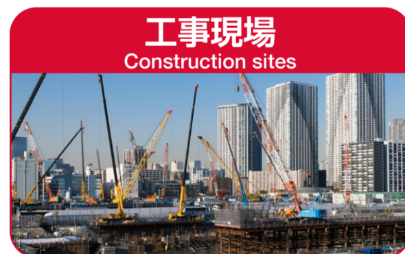
工事現場 Construction sites