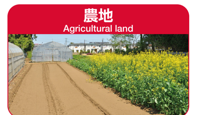
農地 Agricultural land