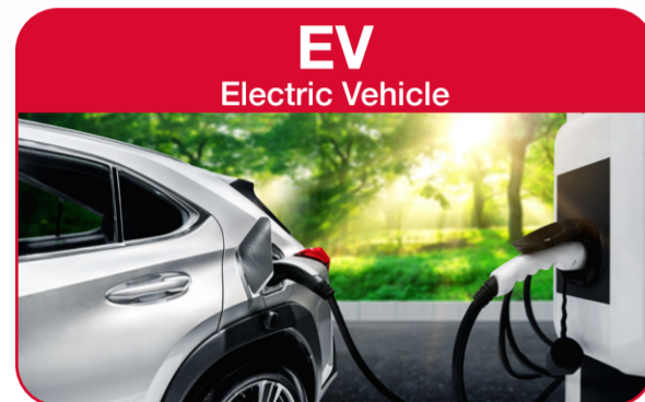
EV Electric Vehicle

Making full use of our technological capability, we can make a satisfied proposal for environmental requirements and conditions