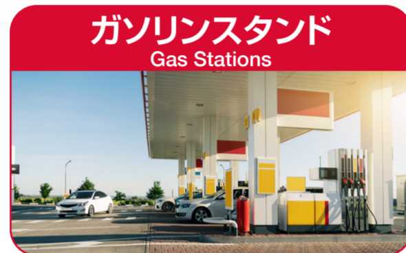
ガソリンスタンド Gas Stations