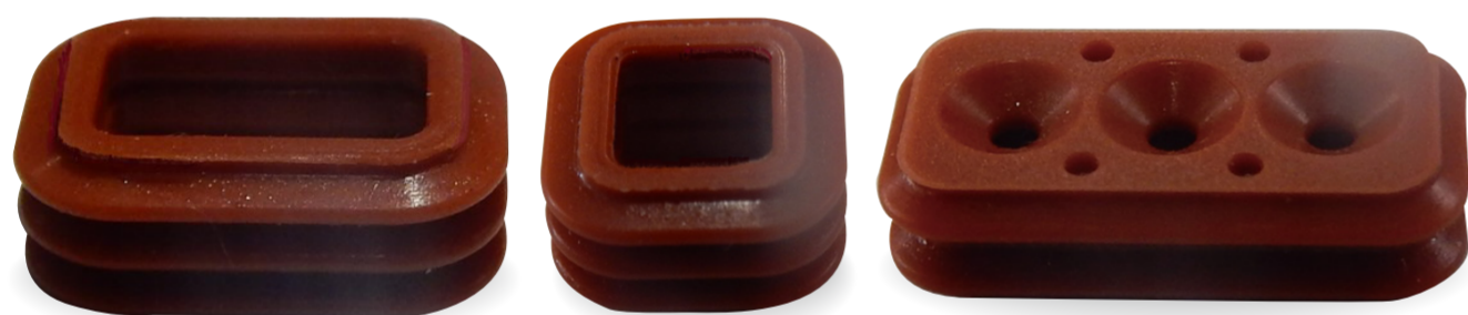
防水パッキン Waterproof packing