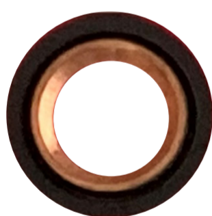
銅+EPDM Copper + EPDM