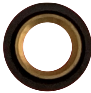
真鍮+NBR Brass + NBR