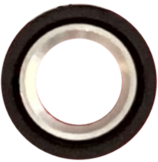
アルミ+NBR Aluminum + NBR