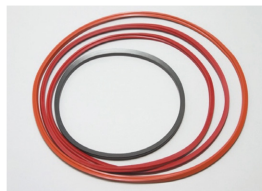
フローティングシール(1.5m~) Floating seals (1.5m~)