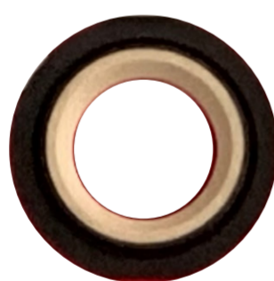
樹(PPS)+EPDM Tree (PPS) + EPDM