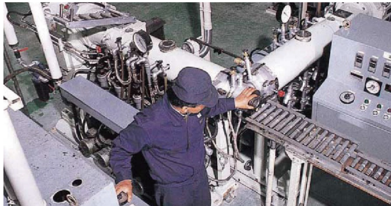
押出スポンジ、ソリッド/ネオロン Extruded Sponge, Solid/Neolon