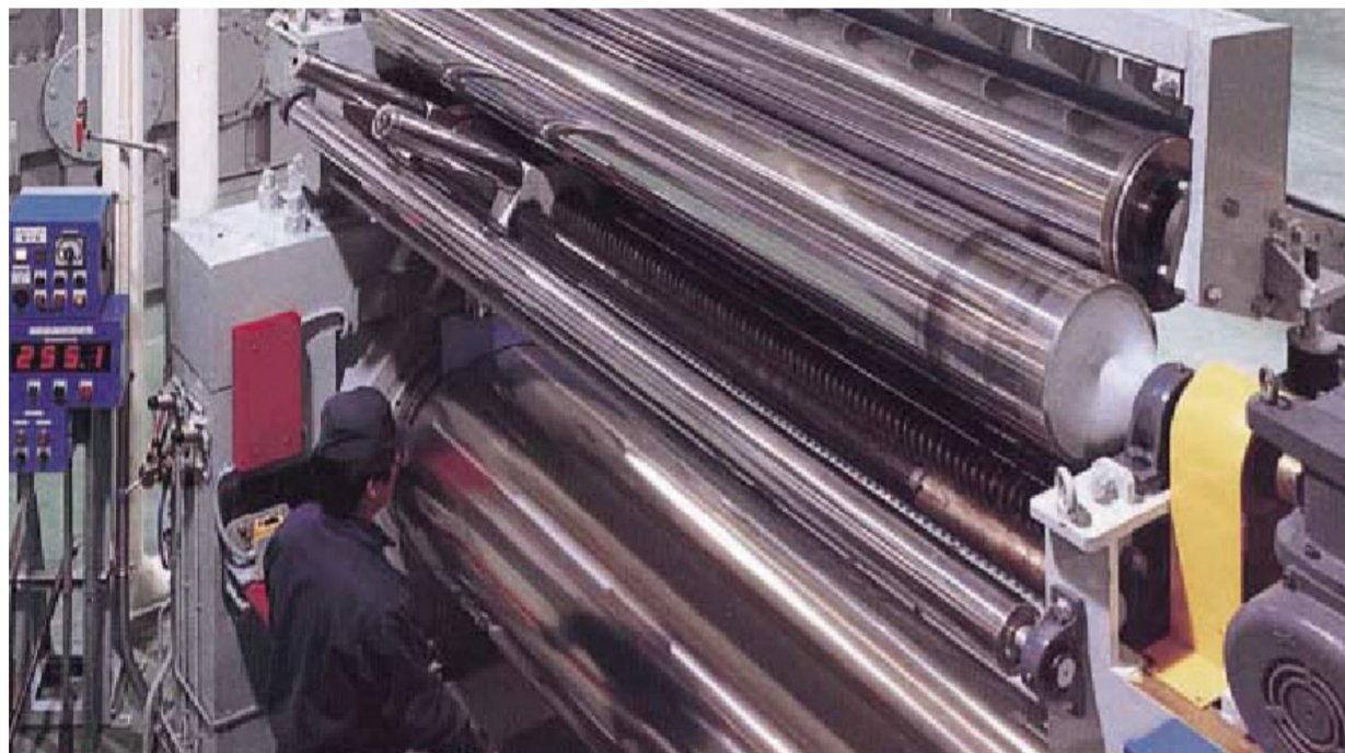
カーボンマスターバッチ(CMB) Carbon Masterbatches (CMB)