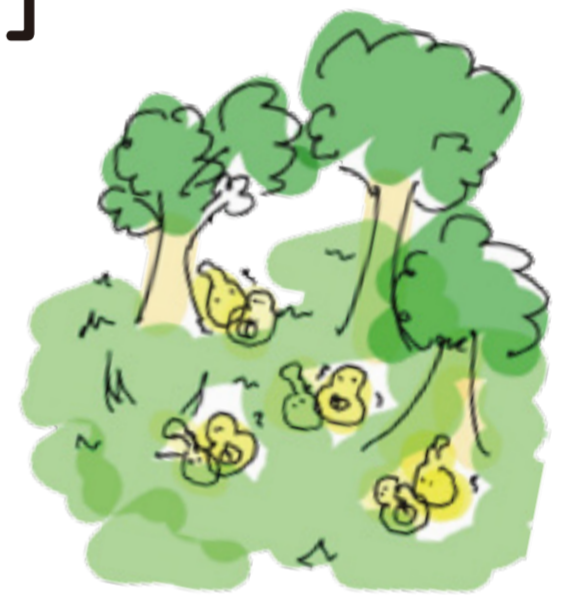
イラスト:永井俊朗